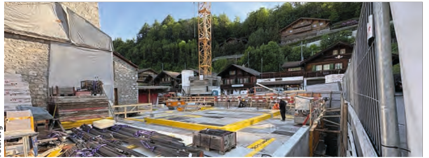
Das Untergeschoss des Neubaus Pfarrhaus in Gstaad ist fertiggestellt. Inzwischen ist der Betondeckel, welcher bodenerdig mit der Strasse abschliesst, gemacht.