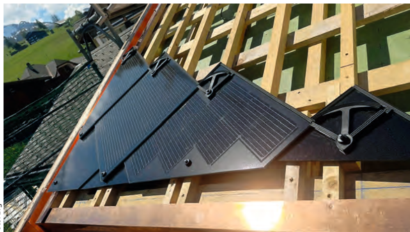
Im Zuge der Dachsanierung der katholischen Kirche St. Franziskus in Zweisimmen wird das Kirchendach mit Photovoltaik-Dachschindeln eingedeckt.